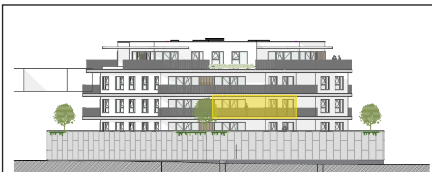
Façade Angle de l'avenue Alphonse Allard et Petite Rue à l'Art