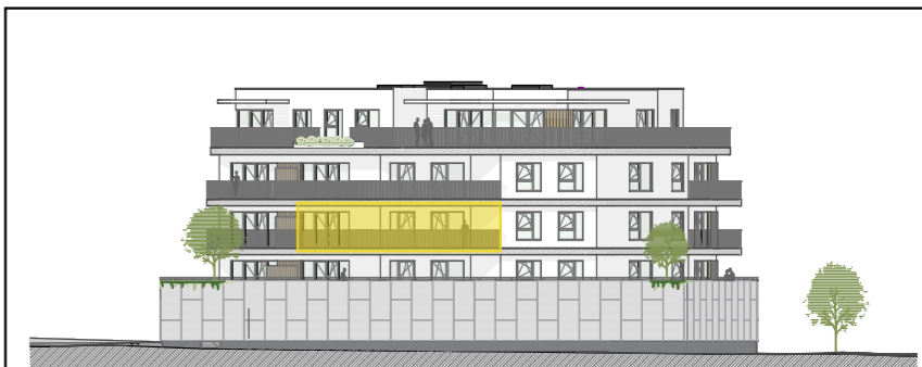
Façade Avenue Alphonse Allard